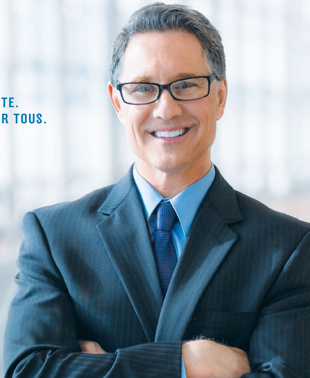
TABLE DES RETENUES À LA SOURCE D'IMPÔT DU QUÉBEC